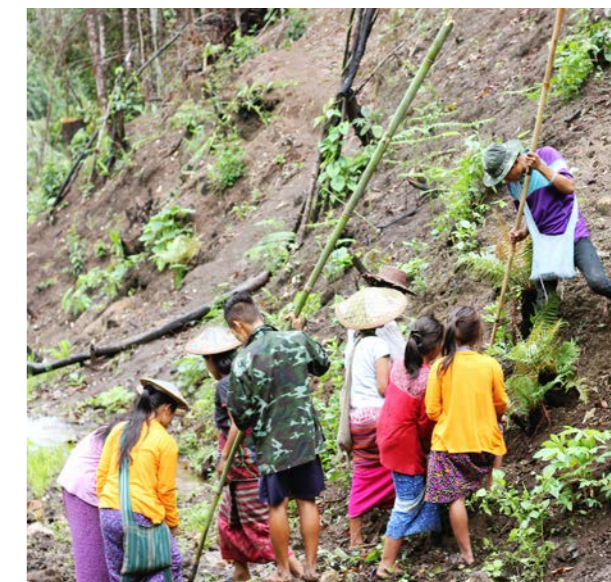
Los aldeanos se reúnen para ayudar a otros a cosechar arroz.