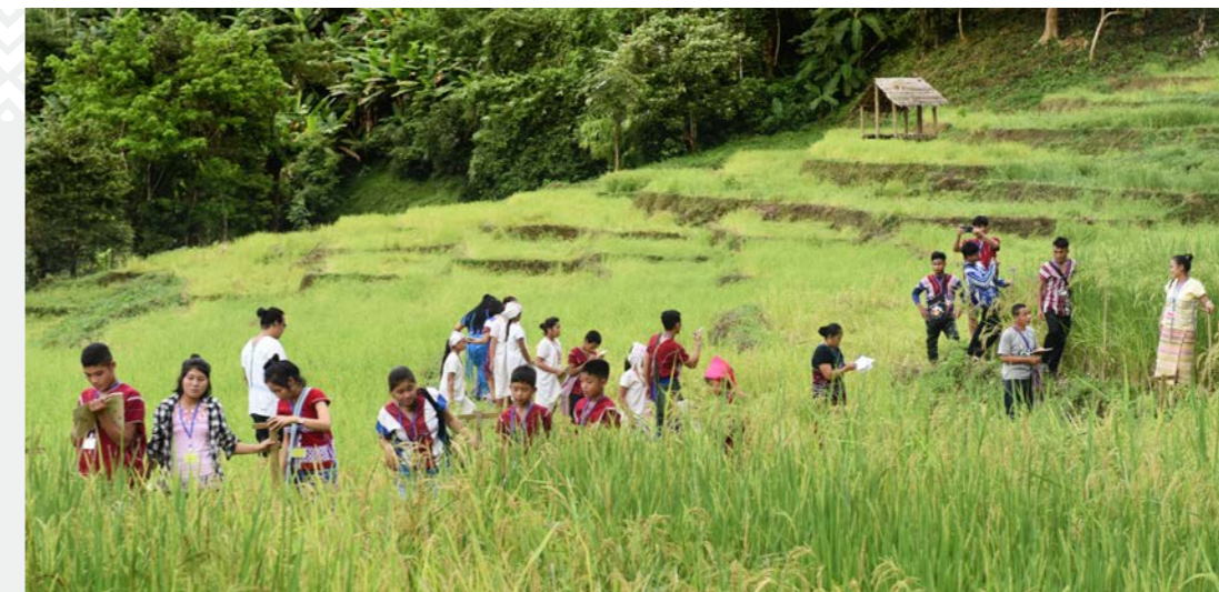
Jóvenes compartiendo en el campo.

El Parque de la Paz Salween establece un sistema democrático de gobernanza liderado por la comunidad con leyes y políticas de apoyo de la KNU que abordan las causas fundamentales del conflicto, incluida la gobernanza democrática, el respeto por la cultura karen y la protección para las comunidades ante el despojo de sus tierras y bosques. Esto se logra mediante el reconocimiento formal de la Asamblea General como el órgano de gobierno del SPP y de los sistemas