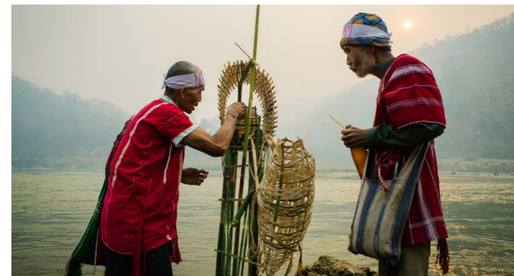
Conmemoración del Día Internacional de Acción por los Ríos y en contra de las Represas.

y una valiosa oportunidad de aprendizaje tanto para las entidades gubernamentales de Birmania como para el mundo en general. A través del Parque de la Paz, y con el apoyo de otros territorios de vida alrededor del mundo, los Indígenas karen de Mutraw nos ofrecen una visión alternativa del futuro: un lugar donde todas las cosas pueden convivir en paz.