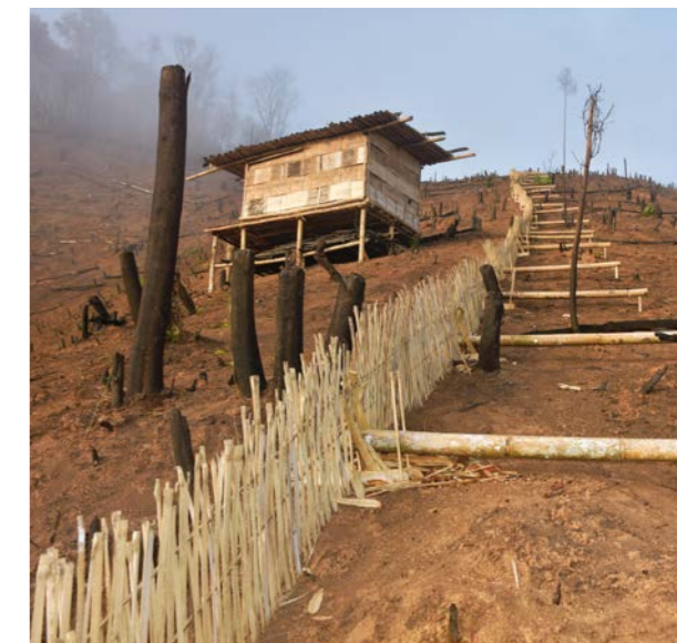
Una trampa tradicional para proteger a la tierra para rotación de cultivos de las ratas.

Estos bosques son el hogar del pangolín malayo, que está en peligro crítico de extinción, junto con otras especies en peligro como los tigres, los elefantes asiáticos, los doles, los gibones, los bantengs y muchas especies vulnerables como los leopardos, los osos negros asiáticos, los osos sol, los gaures y otras 35 especies protegidas por la Convención sobre el