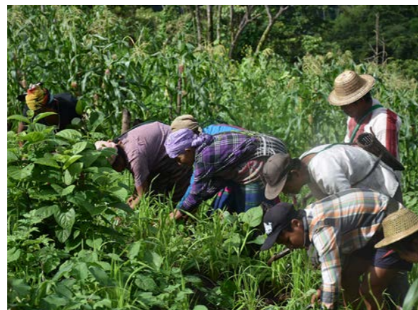
Agricultura tradicional en los Kaw.

Los bosques sagrados dentro del Kaw están protegidos. Estos incluyen cementerios y bosques donde los cordones umbilicales de los recién nacidos se colocan dentro de contenedores de bambú y se atan a los árboles. La esencia vital del infante está conectada