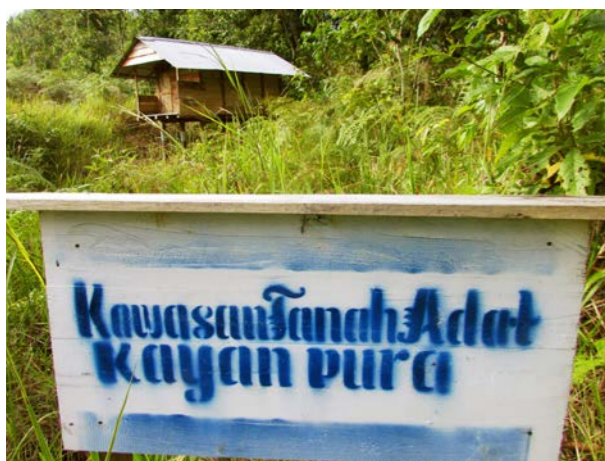
Territorio Indígena Kayan Pura en Apo Kayan-Malinau

El WGII ha tratado de identificar varias oportunidades y lagunas legales para superar el vacío legal actual y abogar por el reconocimiento de los TICCA. Los derechos de tenencia de los Indígenas pueden garantizarse mediante el reconocimiento de los territorios Indígenas más grandes a nivel subnacional