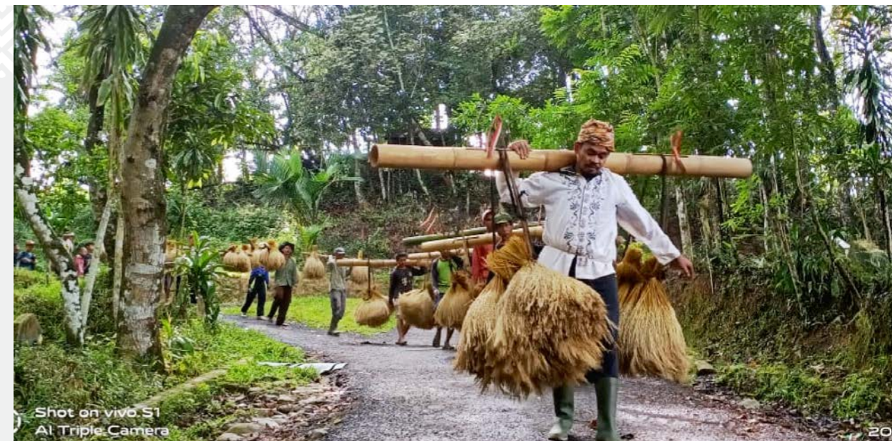
Sistema de agricultura tradicional de la comunidad Kasepuhan.

Actualmente, el avance lento en materia de reconocimiento de los territorios Indígenas y los TICCA, y la consecuente inseguridad en la tenencia, se