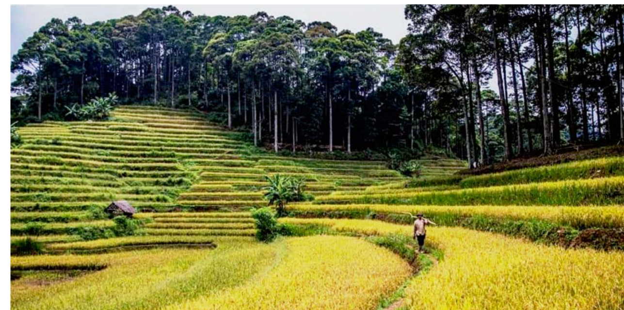
TICCA de la comunidad Kasepuhan Karang.

Los TICCA reconocidos formalmente brindan una manera de responder tanto a la necesidad de proteger los ecosistemas críticos y la biodiversidad, como a la